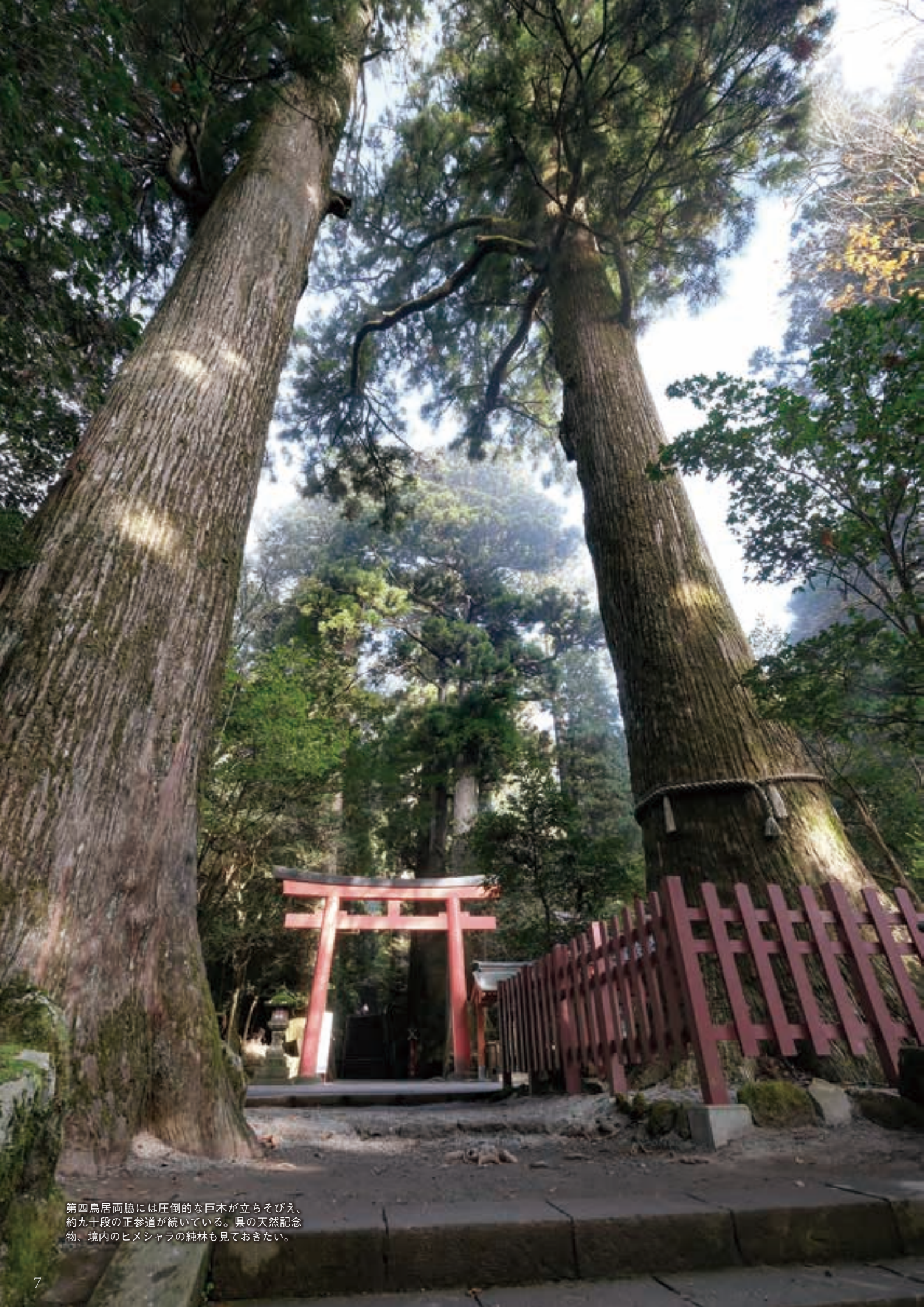
第四鳥居両脇には圧倒的な巨木が立ちそびえ、約九十段の正参道が続いている。県の天然記念物、境内のヒメシャラの純林も見ておきたい。