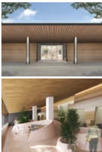
専用ドッグランやインナーバルコニーがついた客室、愛犬と一緒に食事が楽しめるレストランも。※画像はすべてイメージ