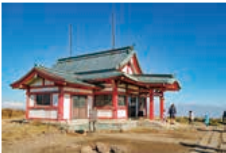
神体山の神山を拝む方向に建つ社殿。毎月24日の月次祭などには神職が滞在、御朱印をいただくことができる。