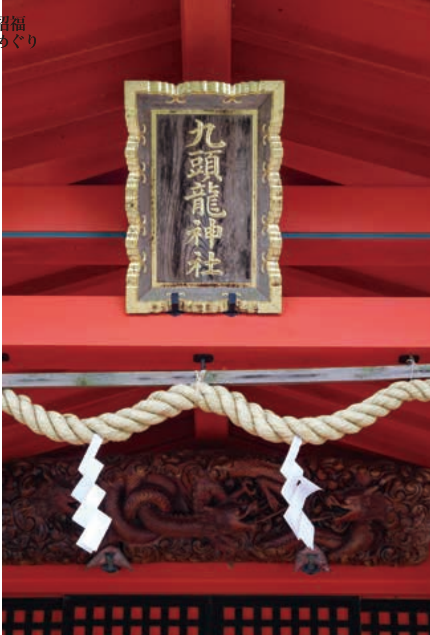
普段は静かな境内だが、毎月13日の月次祭では元箱根から特別参拝船が運行され、多くの参拝者が訪れる。

九頭龍神社本宮のある森は、まさに火砕流の堆積した場所で、あちこちから清水が湧く礫岩層にある。火山活動が、古人には荒ぶる龍の姿に見えたのかもしれない。そんな大地のパワーを秘めた龍神は金運と商売繁盛、縁結びに御利益があるとして人気があり、湖畔の道を歩いて訪れる人も多い。この九頭龍神社本宮と、勝負事に強いという白龍神社は、箱根九頭龍の森「内」にある(入園料600円)。