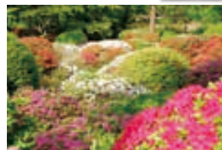
ツツジ 箱根小涌園 蓬菜園