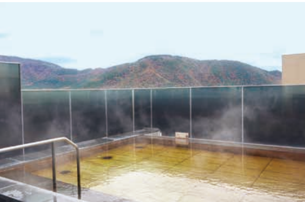
大浴場の露天風呂(左)。ビュッフェには季節に合わせたメニューも(右上)。吹き抜けロビーからは庭園が一望(右下)。