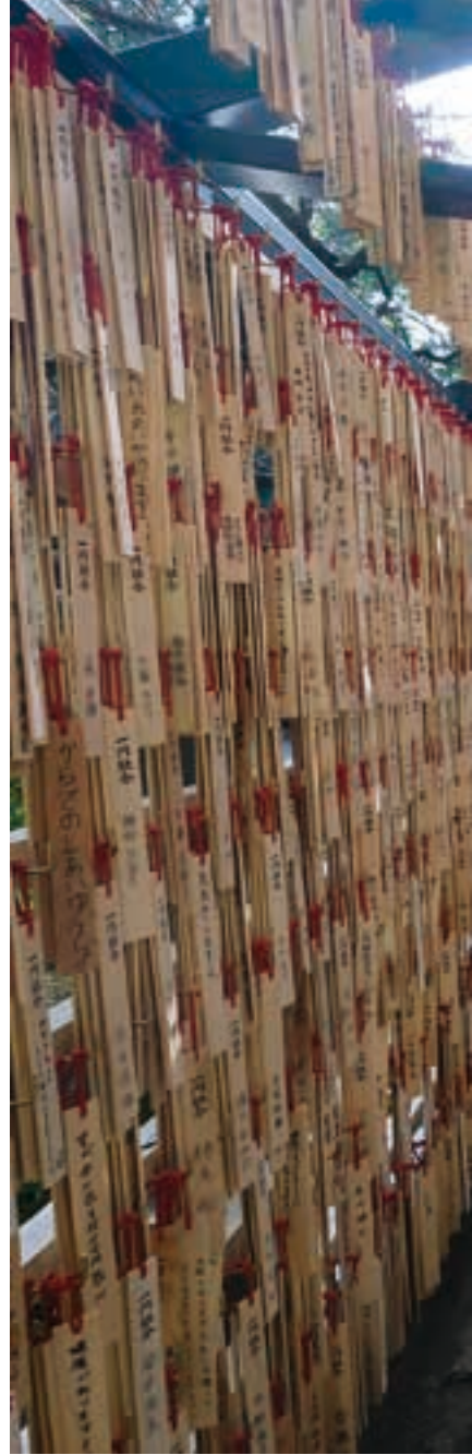
御朱印をいただくと、二宮尊徳の考え方「一元融合」の木札が授与。これに願いを書いて下げる回廊が境内にある。

ている。神明造りの御社殿は1909(明治42)年に建てられたもの。年月を経た柱や床の木肌が、質素を礎とした尊徳の教を伝えていくようだ。建物を支える礎石は天保の大飢饉の際、藩主の命により尊徳が開いて領民に犠牲者を出さなかった城内の米蔵のものとしてされている。日本庭園のように整えられた境内に入ると、さまざまな二宮金次郎像が迎えてくれ、開放的な「きんじろうカフェ」も併設。境内全体が心地よい空間になっている。また尊徳の業績から、学業成就、経営再建や商売繁盛を祈願する参拝客も多い。