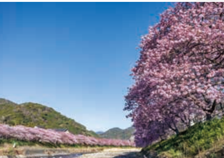
カワヅザクラ 河津川沿い