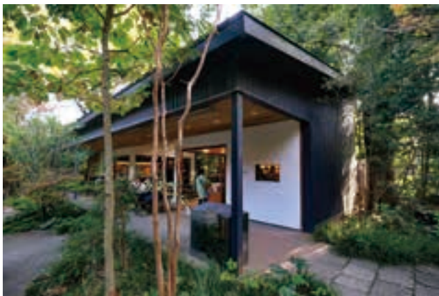
境内の「きんじろうカフェ」。開運土徳ブレンドや尊徳翁が好んだという呉汁など、オリジナルメニューも豊富。10時～16時30分(3～11月は17時まで)、不定休。