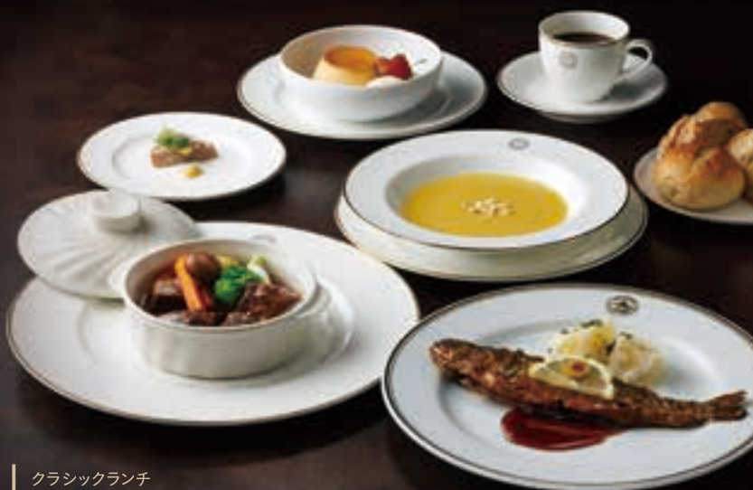
クラシックランチ LUNCH TIME 11:30 ~ 15:30 (L.O.14:00) 8,000円

富士屋ホテルを象徴するメインダイニングルーム・ザ・フジヤで、 伝統の料理を味わう特別な時間を。