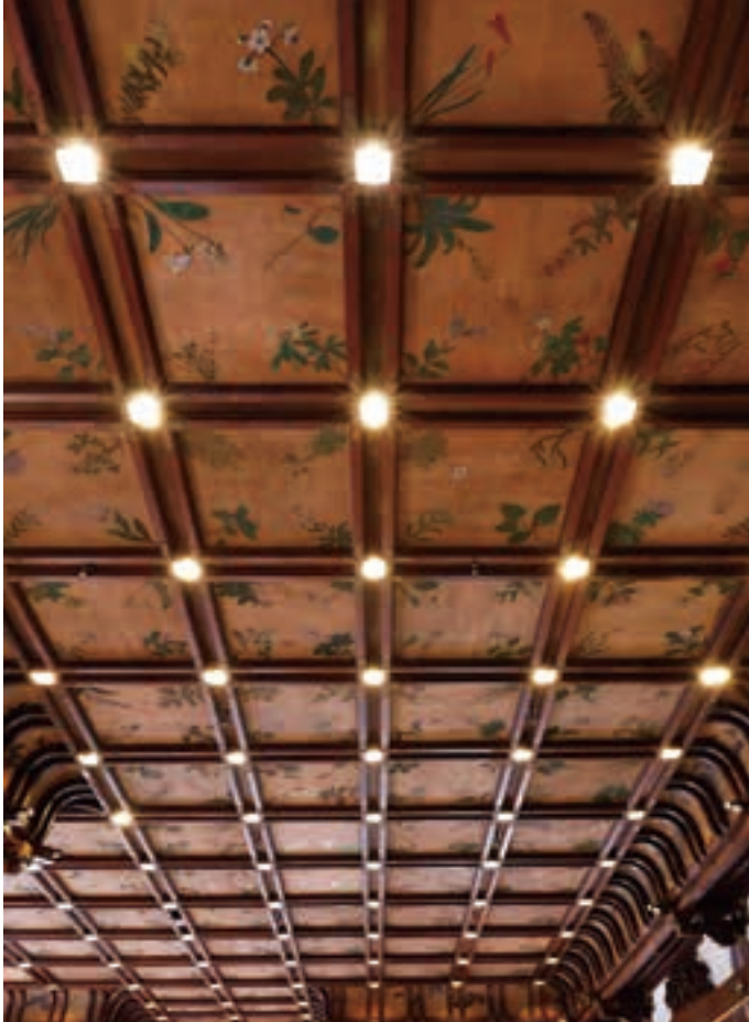
文化財修復のプロにより、90余年前の彩りを取り戻したメインダイニングルームの格天井には、636種の高山植物が。