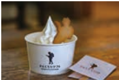
人気のきんじろうソフト500円。尊徳翁ゆかりの、北海道山中牧場の牛乳で作られた報徳練乳ソースが特徴。