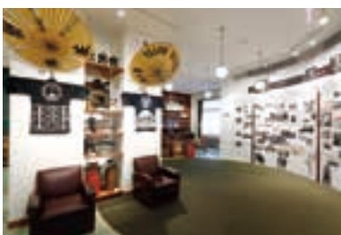
花御殿地下1階のホテル・ミュージアムでは、大改修時の貴重な映像や史料なども見られる。