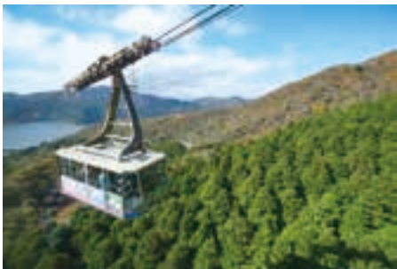
箱根で二番目に高い駒ヶ岳山頂まで、約7分間でのぼる箱根駒ヶ岳ロープウェー。9時～16時30分(上り発車)、往復1,800円。天候不順時は運休あり。