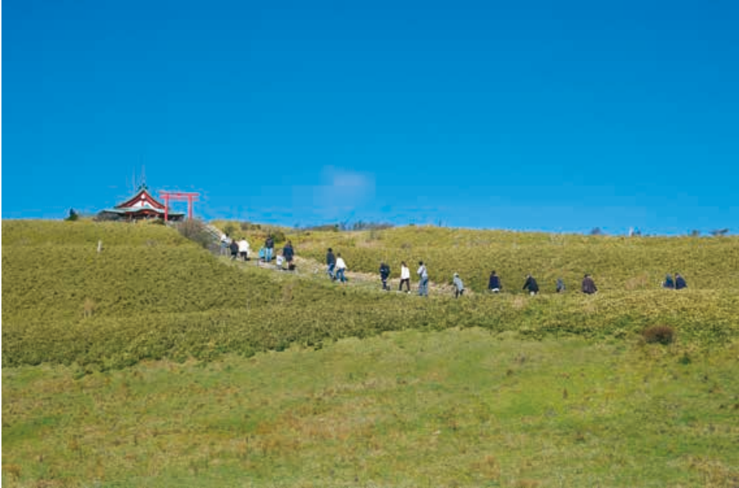
箱根 駒ヶ岳ロープウェー頂上駅から徒歩10分、見晴らしのいい草原を登って箱根元宮に参拝する。