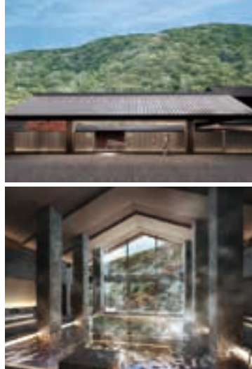
浅間山を背景とするエントランス(右上)。 水着で入る温泉「サーマルスプリング」(右 下)。※画像はすべてイメージ