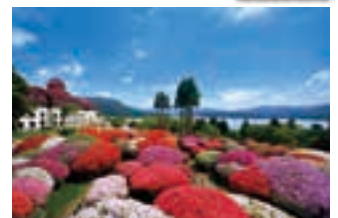
ツツジ・シャクナゲ 山のホテル