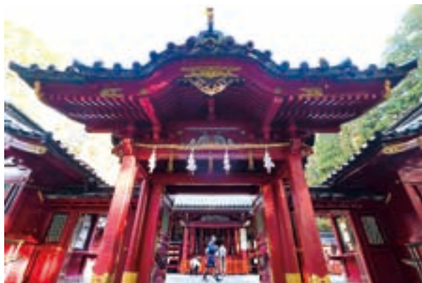
朱塗りの神門の先に権現造りの社殿が現れる。