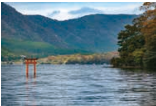
芦ノ湖の神、九頭龍神が祀られる湖上に見える小さな鳥居。普段は容易に訪れることができない場所に立つ。