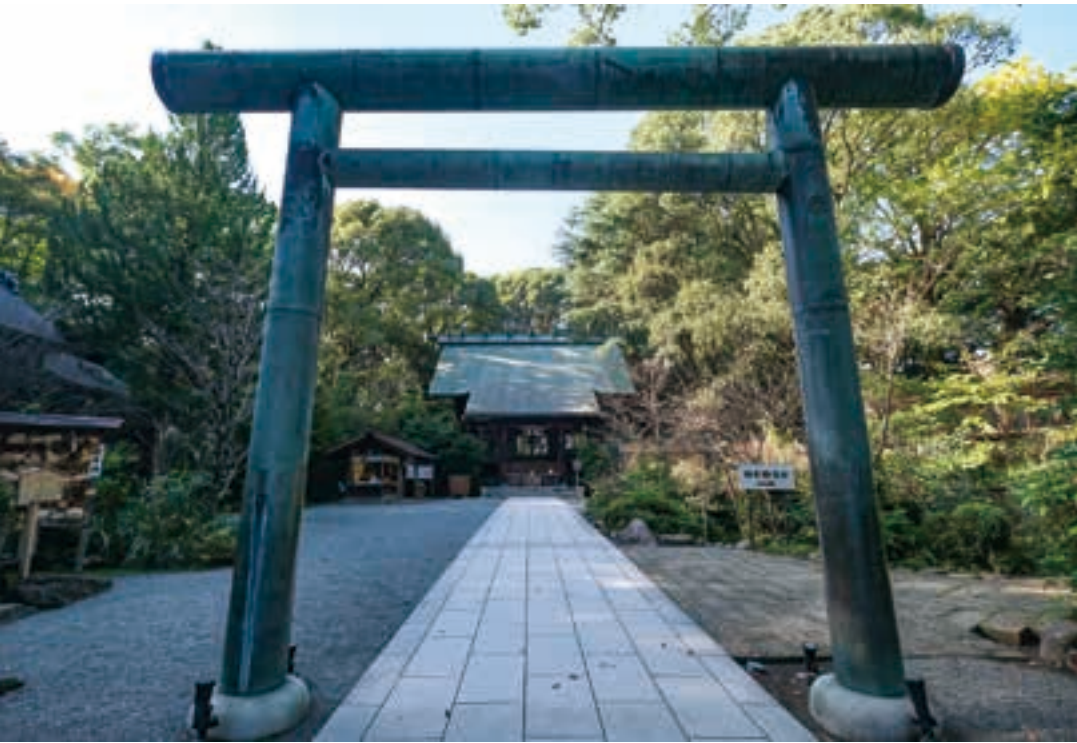
御社殿前は神域らしい凜とした雰囲気が漂う。境内は四季を感じさせる花壇や庭園が整えられている。