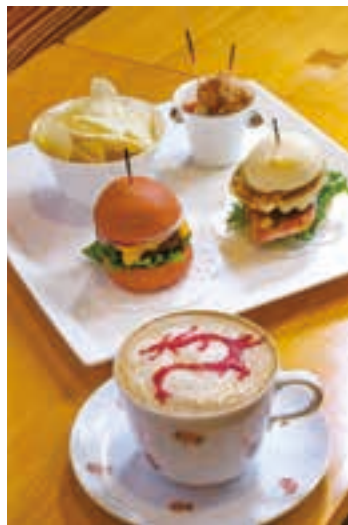
九頭龍神社本宮の入口にあたるザ・プリンス箱根芦ノ湖。参拝の帰りに「ラウンジやまぼうし」で開運祈願の紅白バーガー2,800円と、龍神ラテ1,000円で運気をあげたい。10時30分～17時(L.O.16時30分)、無休。