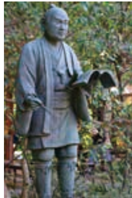
参道の二宮尊徳翁立像。兵庫県の報徳学園より寄贈されたもので、帳面を手にした壮年期の姿を再現。