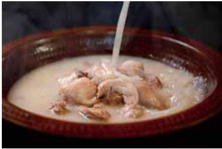
清閑亭の創建者・黒田長成侯爵の出身地である博多の「鶏の水炊き」をコースで味わえる。