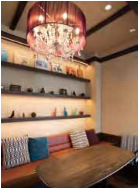
店内最奥、半個室風のソファ席は小さな子どもやグループ利用に最適。