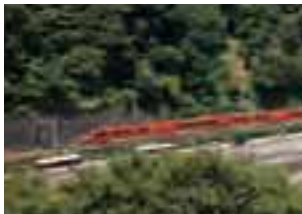
ベランダから見える小田急ロマンスカーはまるでジオラマのよう。