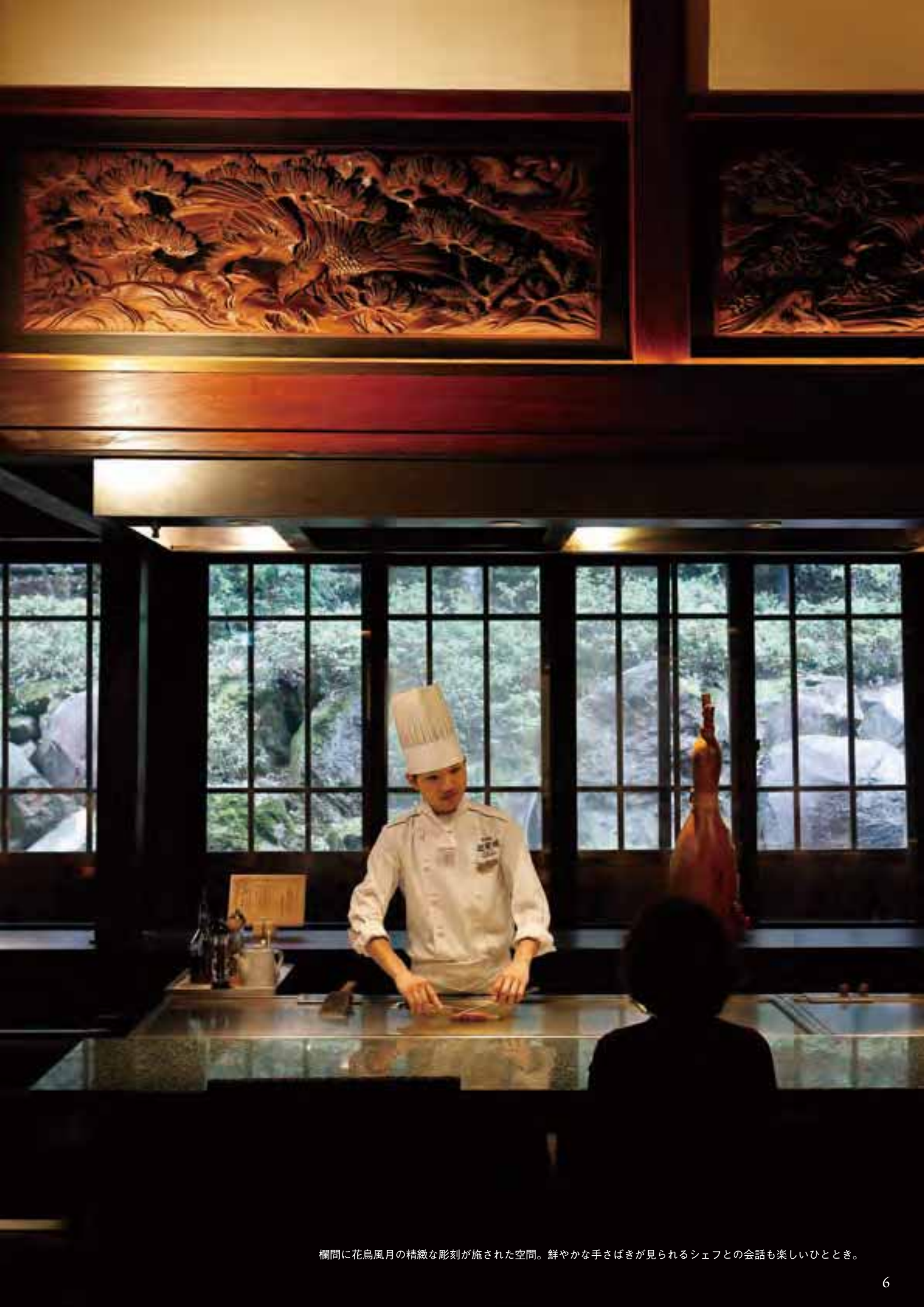
欄間に花鳥風月の精緻な彫刻が施された空間。鮮やかな手さばきが見られるシェフとの会話も楽しいひととき。