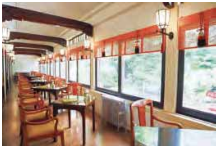
池や豊かな緑を望む庭園側の席。しっとりした風情がある。