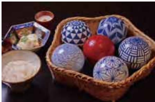
オリジナルの器で提供するランチ限定「珠御膳(たまごぜん)」(写真)やコース料理で、小田原の旬の食材を使った彩り豊かな料理を楽しめる。