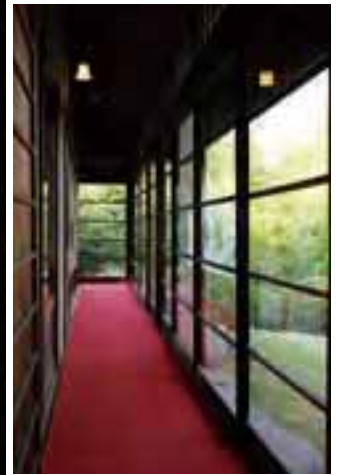
清閑亭の回り廊下から小田原の街と相模湾を望む。庭にある松の樹齢は120年以上(左)。レトロな歪みガラスから庭を望む回り廊下。建具や柱など日本建築の粋が随所に見られる(右)。