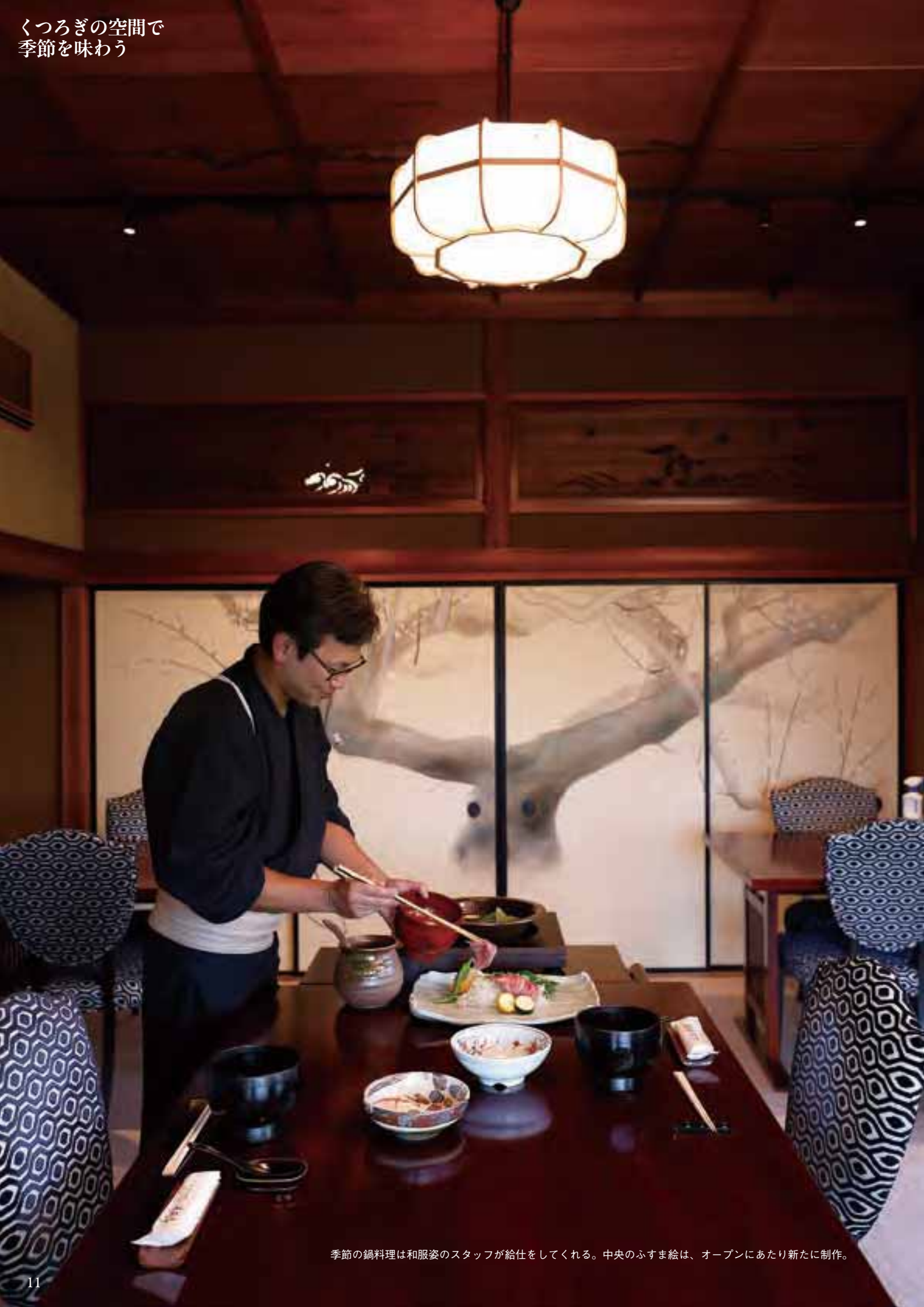
季節の鍋料理は和服姿のスタッフが給仕をしてくれる。中央のふすま絵は、オープンにあたり新たに制作。