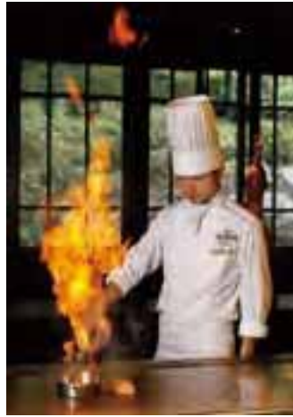
ダイナミックな炎が 上がるフランベ。