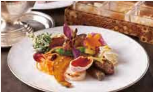
見た目も美しい秋野菜のプレート(上)。 不動の人気を誇る「ビーフカレー」(下)。