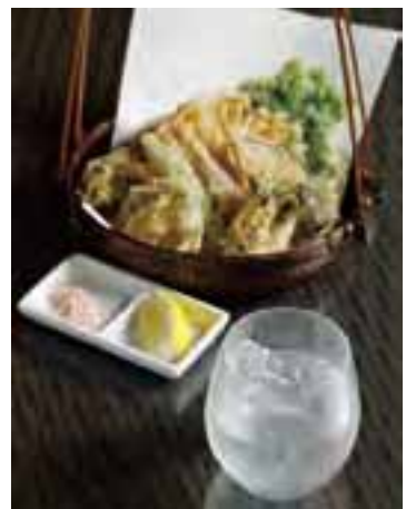
岩塩やレモンでいただく天ぷらは、さわやかで軽快な口当たりの「れもん冷酒」が好相性。