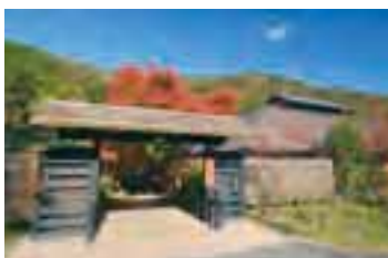
10時の温泉の営業開始と同時に訪れる人も多い。