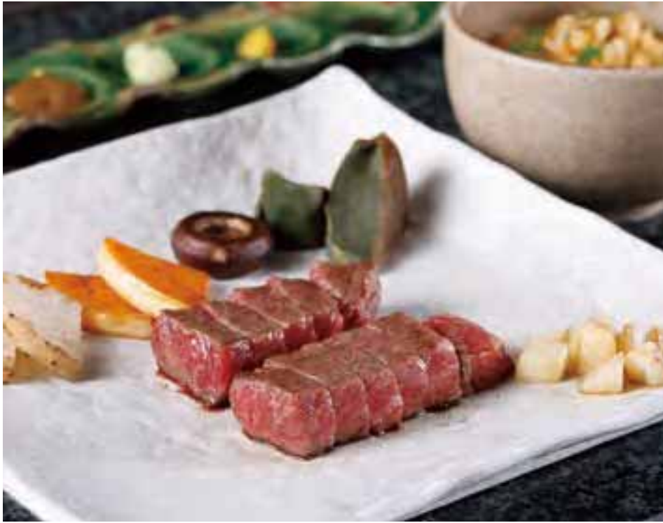
松阪牛のステーキには季節の焼き野菜や大平台の生麩なども付く。右奥は人気のガーリックライス。