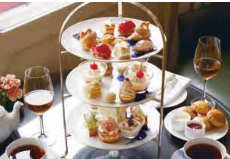
手の込んだスイーツやセイボリーとのマリアージュを楽しむアフタヌーンティーセット。ドリンクはおかわり自由。