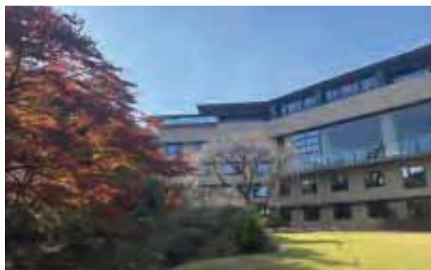
自然豊かな庭園側のホテル外観(上)。宿泊者はユネッサンの利用が無料に(下)。