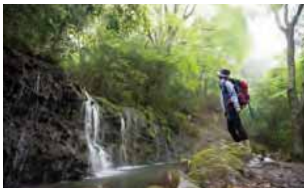
涼スポット「千条の滝」(上)。国登録有形文化財「箱根小涌園 三河屋旅館」(下)。

神奈川県足柄下郡箱根町元箱根45-3(元箱根港) 運航時間/9時20分～16時30分(時期により異なる)