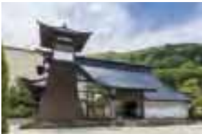
建物は国登録有形文化財に指定されている。

明治8(1875)年に建てられた、神奈川県愛甲郡中津村の名主の家を移築し、レストランとして親しまれているのが「鉄板焼 迎賓館」だ。梁や柱、建具などは当時のまま。ケヤキを主材に、京都から呼び寄せた宮大工が釘を一本も使わず組み上げた建物は、過去の大地震にもびくともしなかったそう。 重厚な空間に備わる席は、すべて鉄板を目の前にしたカウンター。シェフの臨場感あふれる技を見ることが出来る。青森県産なんば味噌、伊豆のすりたて本わさびなど、5種の薬味で味わう松阪牛は格別で、メのガーリックライスに使われたシソが口中をさっぱりさせてくれる。 デザートはフレンチトーストがフランベされる際には思わず歓声上がる。五感で楽しめるのも鉄板焼きの醍醐味だ。