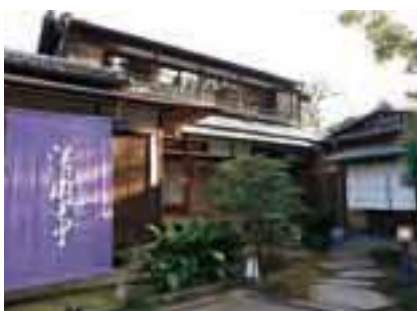
げんこうがた 建物の棟をずらす雁行型とよばれる形状で、明治39(1906)年に建てられた清閑亭。