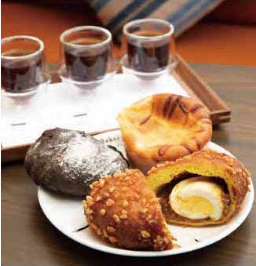
手前はベーカリーで一番人気の「米粉のカレードーナツ」。3種のコーヒーの飲み比べもできる。

鳥居や外輪山など、広がりのあるパノラマは爽快で、紅葉が彩りを添える秋景色はさながら絵画のような美しさだ。 豆はカウンターに設置した焙煎機で自家焙煎。ケニアやエチオピアなどのスペシャルティコーヒーのほか、箱根や芦ノ湖をイメージしたオリジナルブレンドも。1階のベーカリーで購入したパンをここで味わうこともできる。