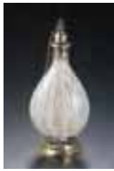
香水瓶 1690年ごろ イタリア 海の見える社美術館蔵