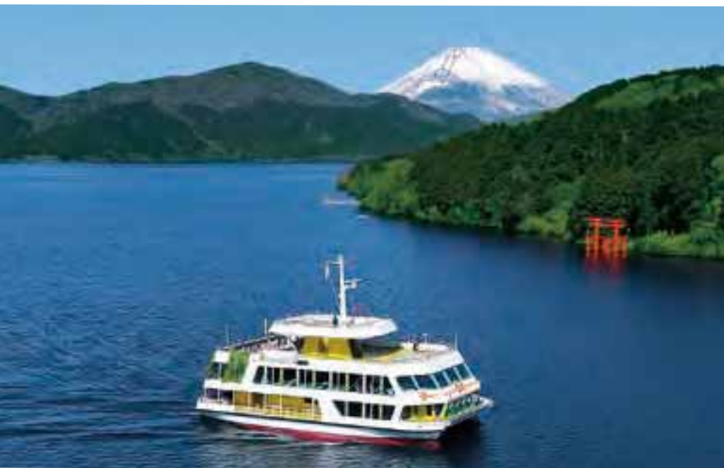
記念撮影にぴったりな富士山型モニュメント(右上)。のんびり湖を眺められる小上がりスペース(右下)。