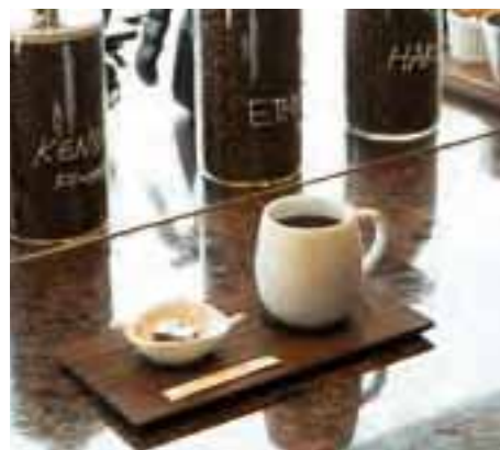
コーヒーには、熱海にある老舗の一口サイズの羊羹(ようかん)が添えられている。