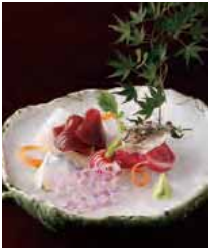
自由な発想と繊細な技で仕上げた向付。 二十四節気に合わせて献立が変わる。