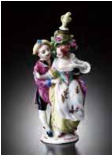
踊る男女像香水瓶 1751～54年ごろ イギリス 箱根ガラスの森美術館蔵