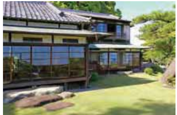
数寄屋風の造りで、平屋と二階家が連なる。その形状は、雁行型(がんこうがた)と言われる。