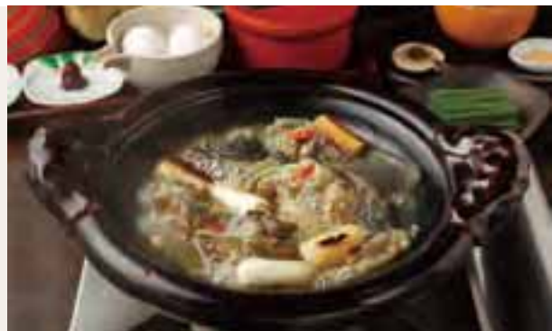
滋養たっぷりのすっぽん鍋(上)。すがすがしい山の空気を感じられる野天風呂(下)。