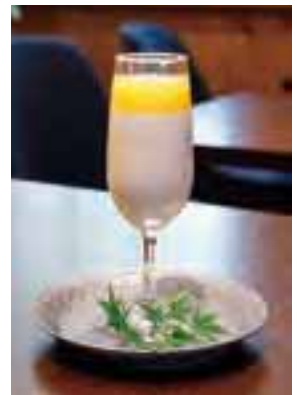
黒田侯爵が英国で好んだ紅茶にオレンジソースを合せた「清閑亭プリン」。併設している蔵カフェで味わえる。