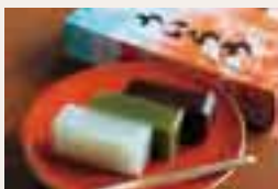
きな粉が香る「わらび餅」(上)。室町時代から作り続ける「ういろう」(下)。

メニュー／ ういろう(白・茶・小豆・黒) 各756円 栗ういろう 972円 わらび餅 1,296円