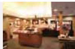
カットサイズもあるので2種を食べ比べたい(左)。アンティークが素敵な店内(右)。

メニュー／ 湘南ゴールドソフトバウム 沖縄黒糖ハードバウム ホール 各1,280円 カット 各640円