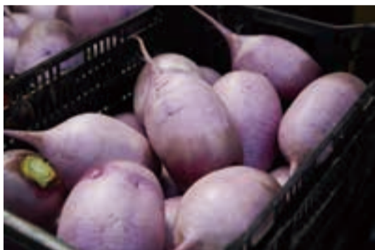
[右]丸々と育った紫大根。サラダなどに使われるという。[左]独特な形状のロマネスコなども。