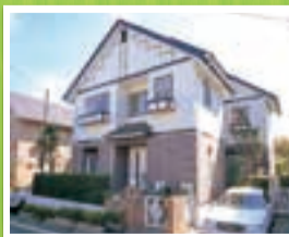
屋根と外壁は台風や雨による浸水被害が起こる前に定期的にメンテナンスを!(上)。飛散防止フィルム(右上)。雨水タンク(右下)。