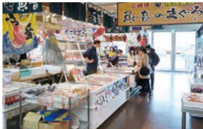
三浦の旬が一堂に集まる「うらりマルシェ」の「やさい館」と「さかな館」。