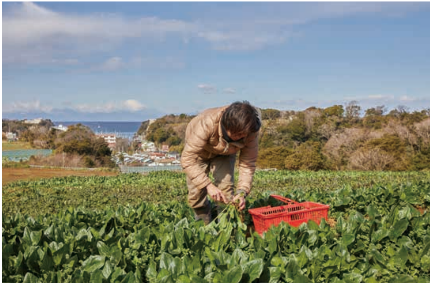
相模湾と富士山を望む青木農園。海風が運ぶミネラルが野菜たちにほのかな塩味をまよわせる。