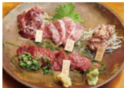
三崎ならではの楽しみは、マグロのさまざまな部位を使っ ての料理。