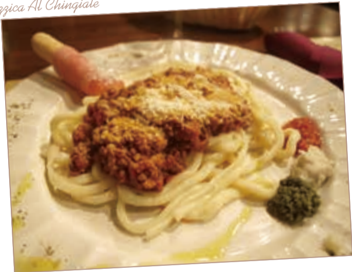
Pizzica Al Chingiale

るが、一番のお勧めは、イノシシ肉を使ったミートソースのピンチ・アル・チンギヤレ。これに、ブルネッロ・デイ・モンタルチーノの弟分的存在で軽めでフルーティーなタイプのロツソ・デイ・モンタルチーノが、とつてもよく合う。一応乾麺も売っているのだけれど生パスタとは雲泥の差なので、何度か買ってもらうやめた。乾麺を買って帰るぐらいなら、手打ちの讃岐うどんを使った方がずつと美味しいと思うからだ。ふり返ればこのトスカーナ詣では、もうすぐ20年になる。でも行くのは必ず2月で、ブドウ畑では芽も出ていなければ葉っぱもない。できればいつか、緑豊かな季節に行ってみたいなあ、と思ったりするのでした。